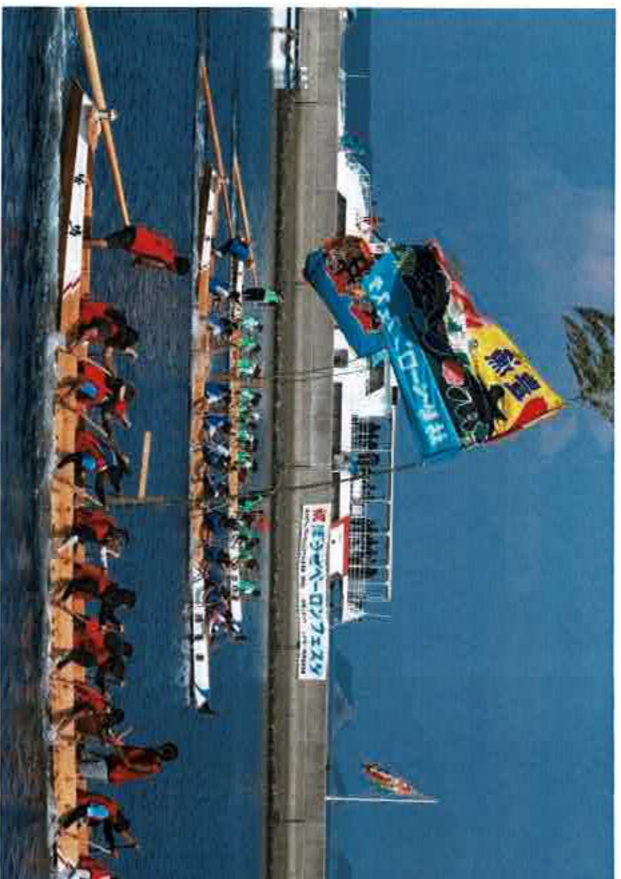
※写真は、2017年 港対抗の部